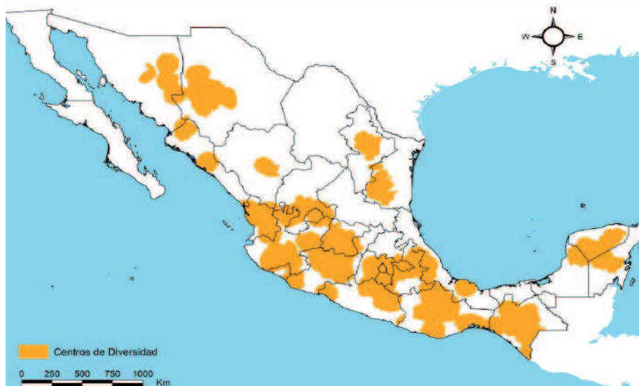
Figura 6. Centros de diversidad genética de maíz nativo de México con colectas realizadas de 1926 a 2014.