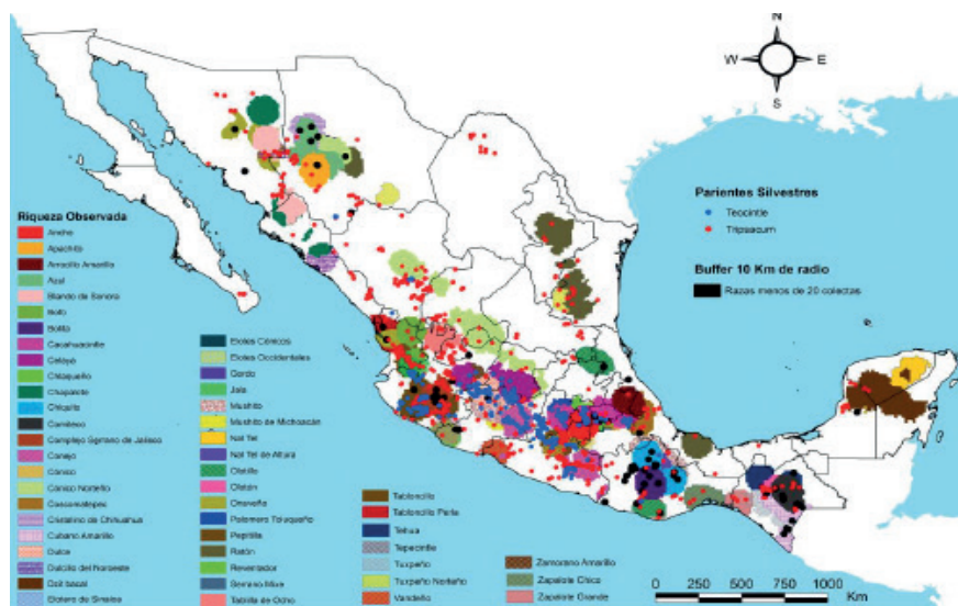
Figura 5. Zonas de riqueza genética de las razas nativas de México.