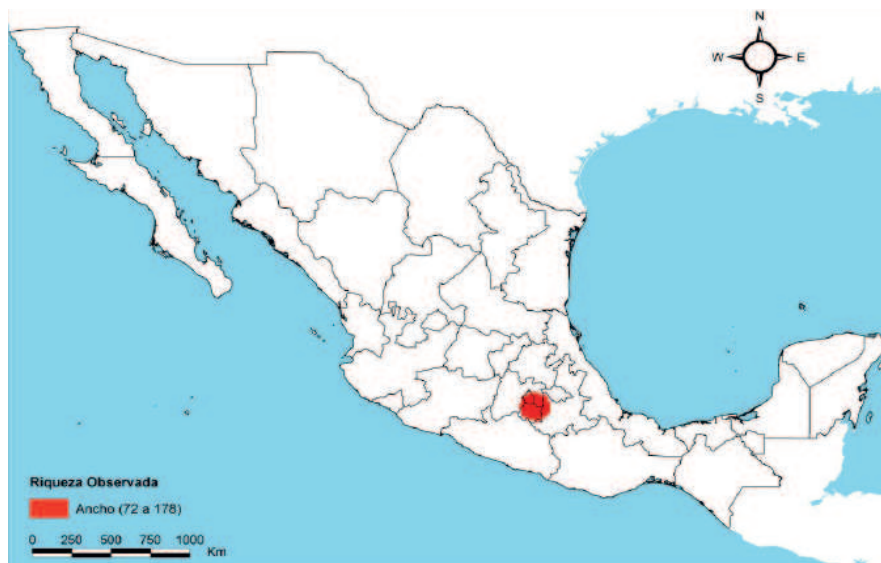
Figura 3. Zona de riqueza genética de la raza Ancho.