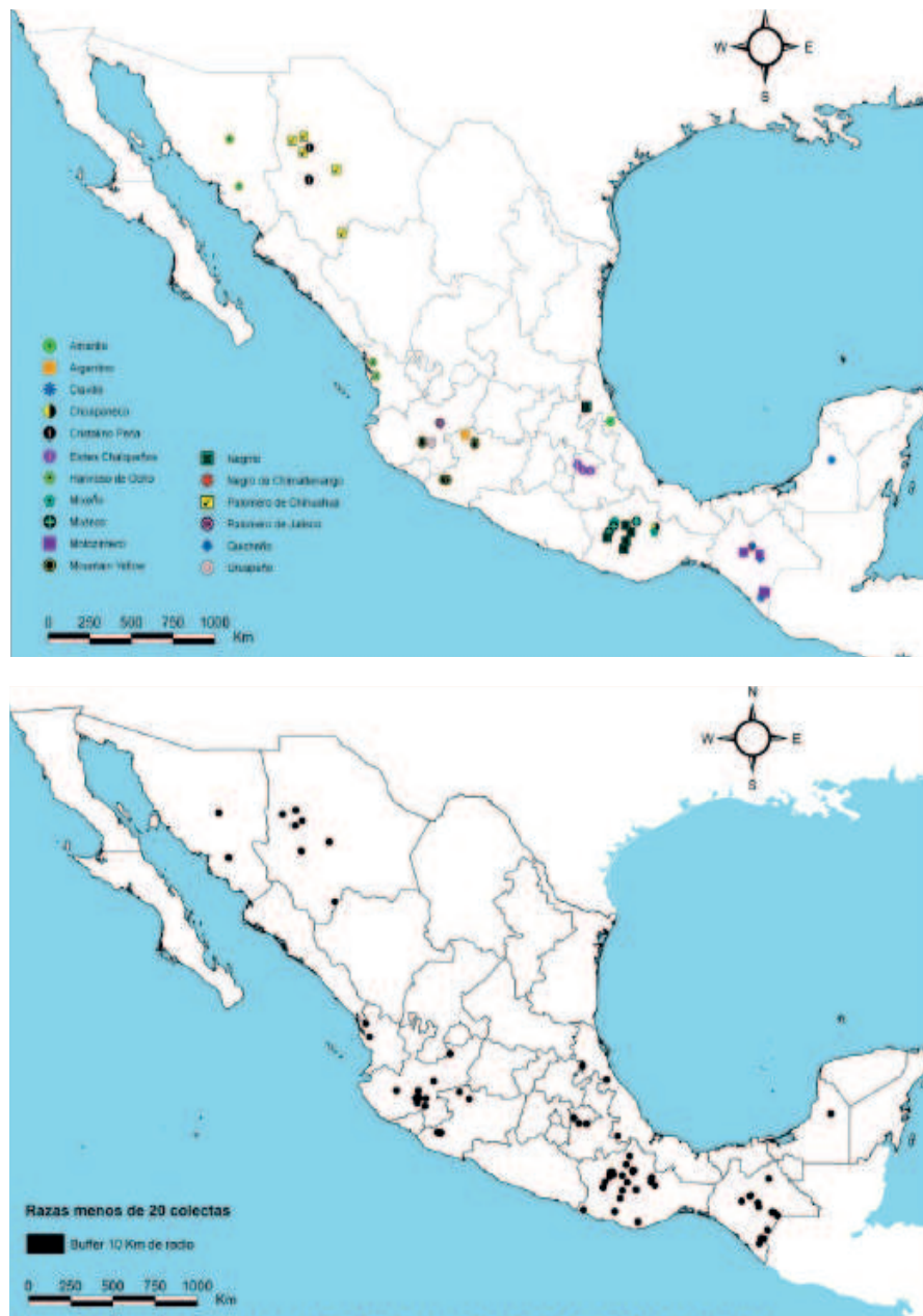
Figura 4. Razas con menos de 20 colectas con franjas de amortiguamiento de 10 km de radio.

dirigida en regiones específicas que permitan identificar y documentar las razas nuevas que se vayan generando a través del tiempo, así como sus regiones de diversidad.